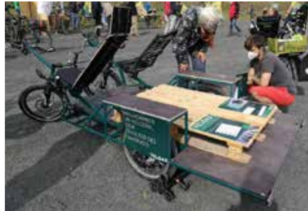
1 zweisitziges vierrädriges Schwerlastenrad: VELOAD Coria