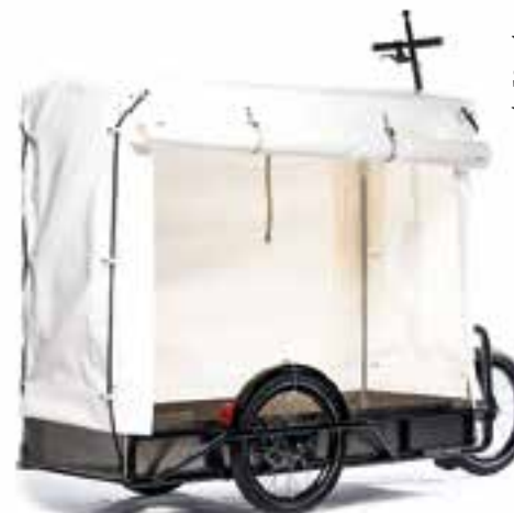
1 dreispuriger Schwerlast-Anhänger: Carla Cargo mit Paul Plane