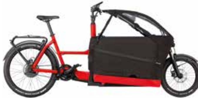
10 einspurige Lastenräder: Riese & Müller Packster 80 business mit Kindersitzen und Verdeck