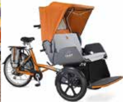
2 Rikschas: Van Raam Chat