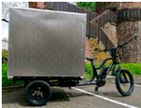
3 Dreispurer: XCYC Pickup Work 4.0 mit Kofferausbau